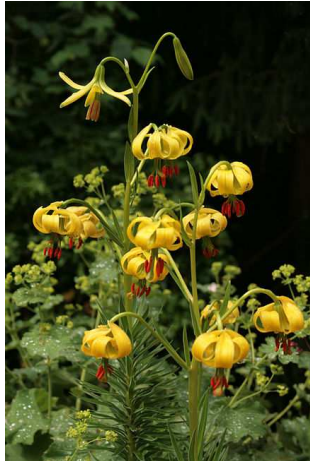
Lys des Pyrénées